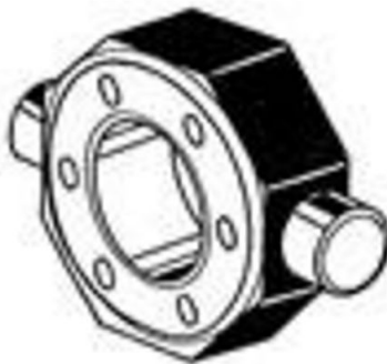
KARDAN-ADAPTER / ADAPTERKONSOLE